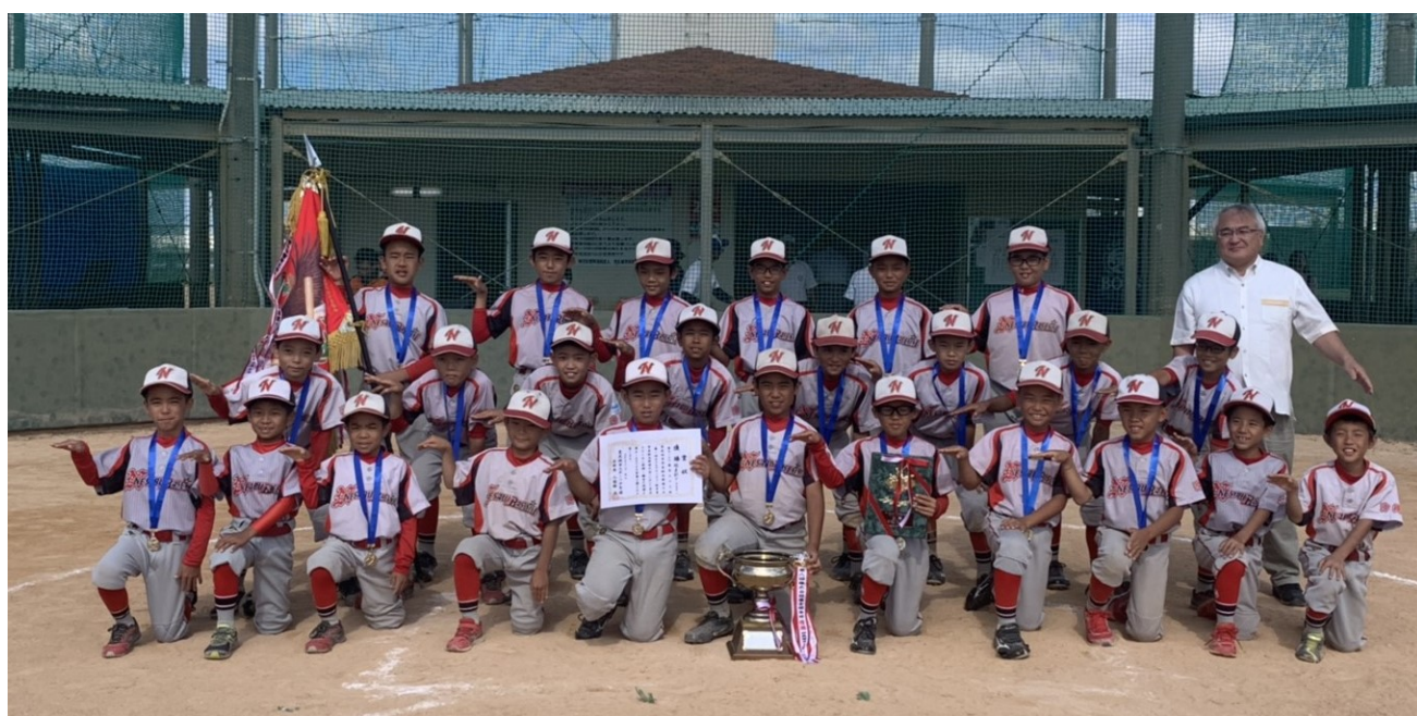
第1回ホテルグランビューホテルズ杯 優勝チーム:根差部ベースライン