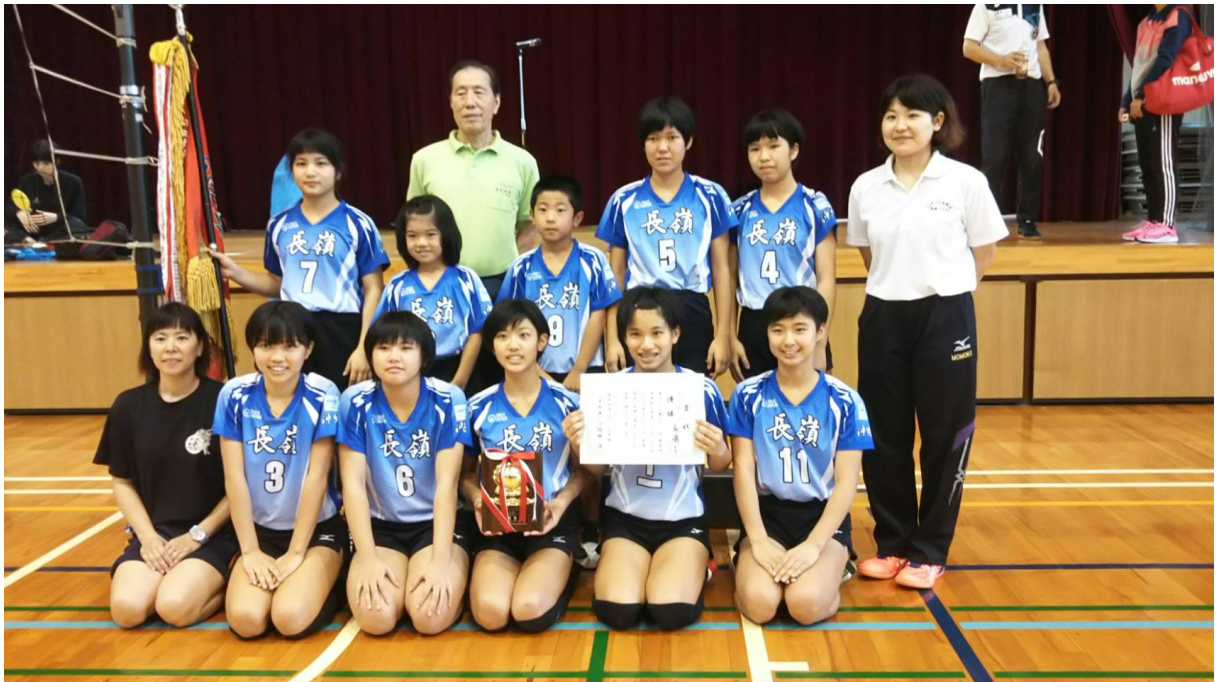
第18回市長杯優勝：長嶺クラブ